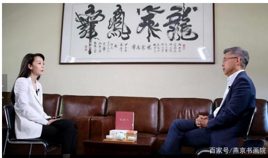
网络图片：某高校悬挂的书法作品，被网友吐槽为“江湖书法”，有辱学校声誉。